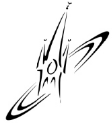
St. Johannes der Täufer Elz

Die Einladung gilt allen , die gern in Gemeinschaft essen wollen.