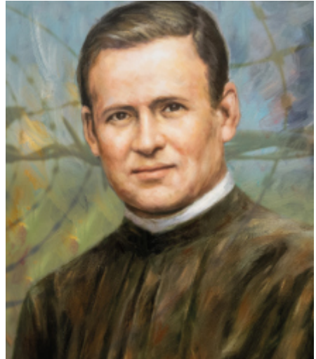
Pater Richard Henkes

Als Typhus ausbricht, lässt er sich mit den Kranken einschließen, um sich zu kümmern und stirbt im Dienst am Nächsten am 22. Februar 1945.