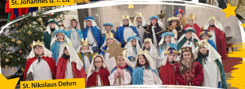
St. Nikolaus Dehrn