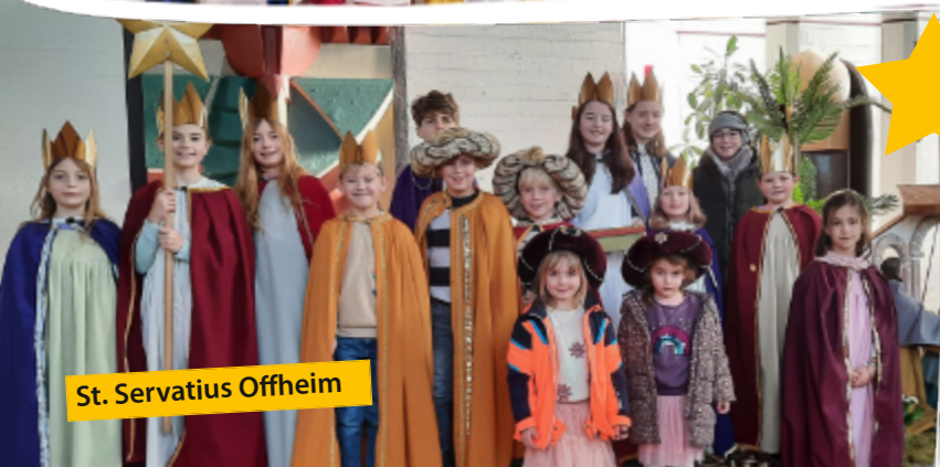
St. Servatius Offheim