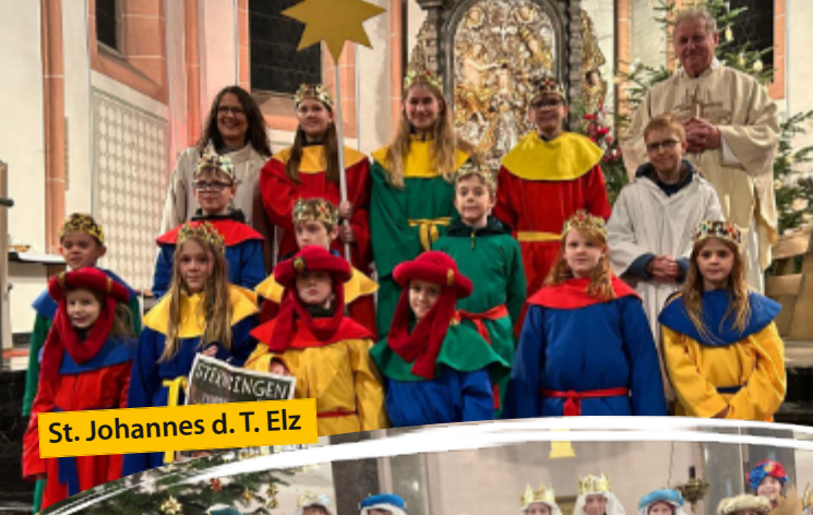
St. Johannes d. T. Elz