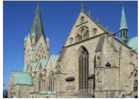
Südseite des Paderborner Doms

Aufgrund zahlreicher Anfragen freue ich mich, schon jetzt die diesjährige Pfarrwallfahrt ankündigen zu können, zu der ich Sie herzlich einlade.