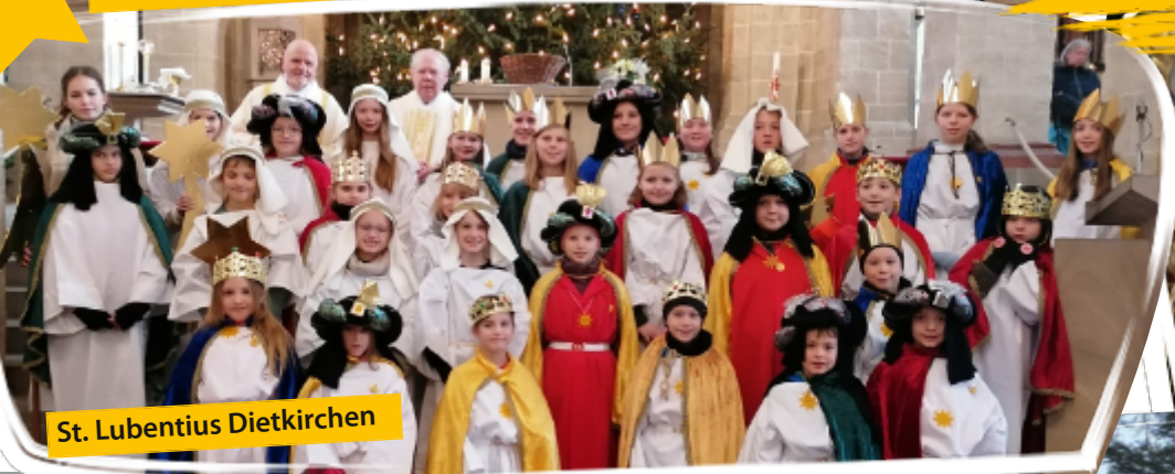
St. Lubentius Dietkirchen