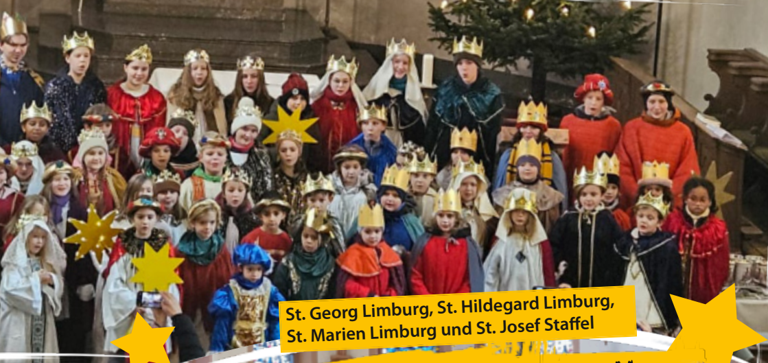
St. Georg Limburg, St. Hildegard Limburg, St. Marien Limburg und St. Josef Staffel

HERZLICHES DANKESCHÖN an Sternsingerinnen und Sternsängern sowie deren Begleitpersonen!