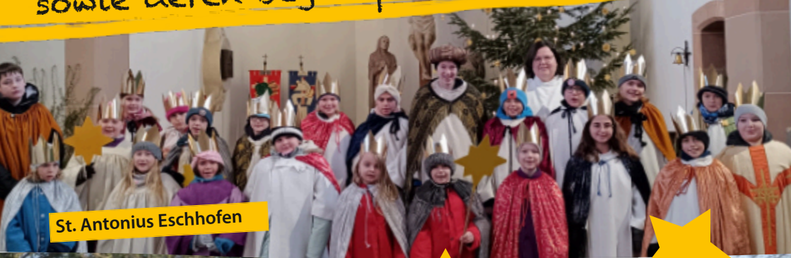
St. Antonius Eschhofen

HERZLICHES DANKESCHÖN an Sternsingerinnen und Sternsängern sowie deren Begleitpersonen!