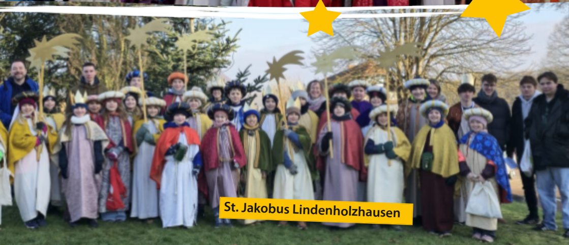
St. Jakobus Lindenholzhausen